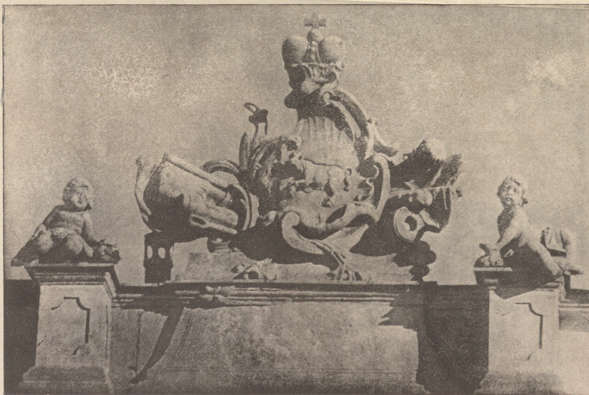
Zamek królewski w Warszawie.