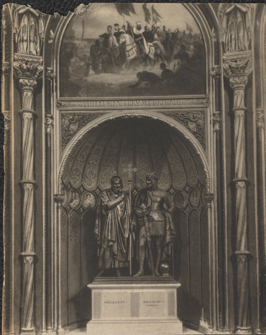
Pomnik Bolesława I i Miecysława I w katedrze.