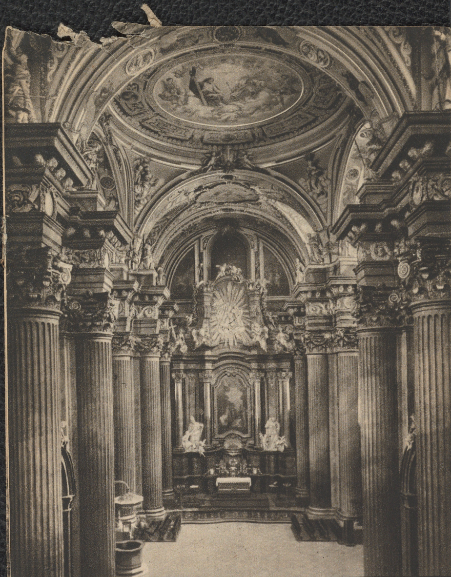
Wnętrze kościoła farnego.