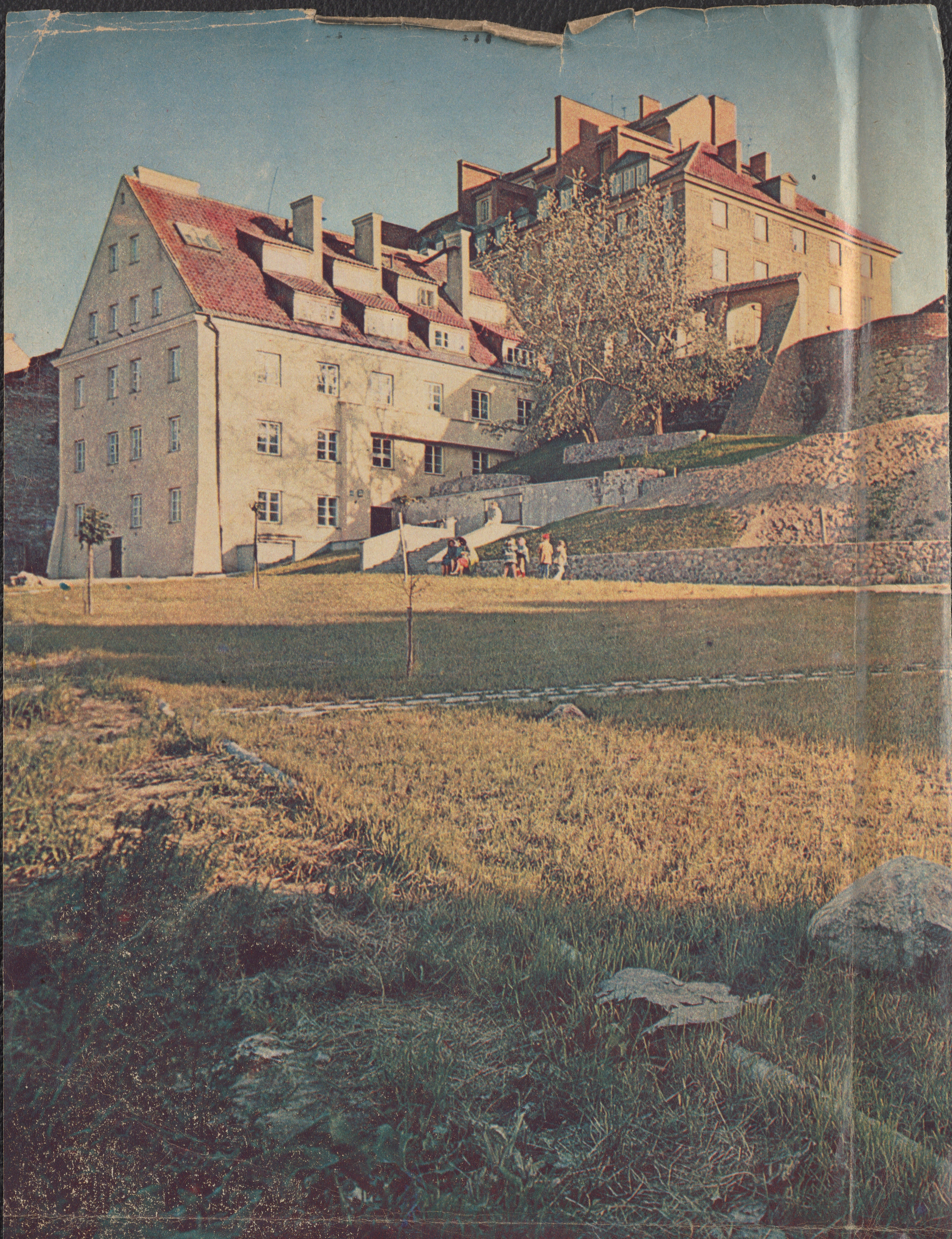
MURY OBRONNE WARSZAWY OD STRONY ULICY BRZOSZOWEJ I KRZYWEGO M