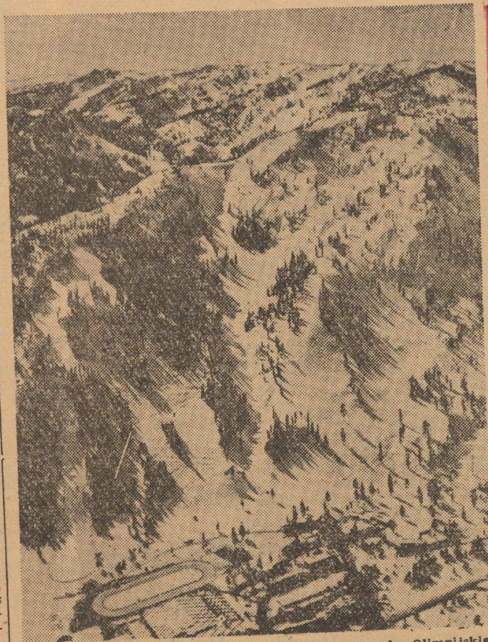
Tak. To tutaj rozegrane zostaną nadchodzące Igrzyska Olimpijskie. Na naszym zdjęciu Squaw Valley w całej krasie.

AFP (Francja) — 1) Kuźniecowa (ZSRR), 2) Piątkowski (Polska), 3) Altig (NRF), 4) Johansson (Szwecja), 5) Schranz (Austria), 6)