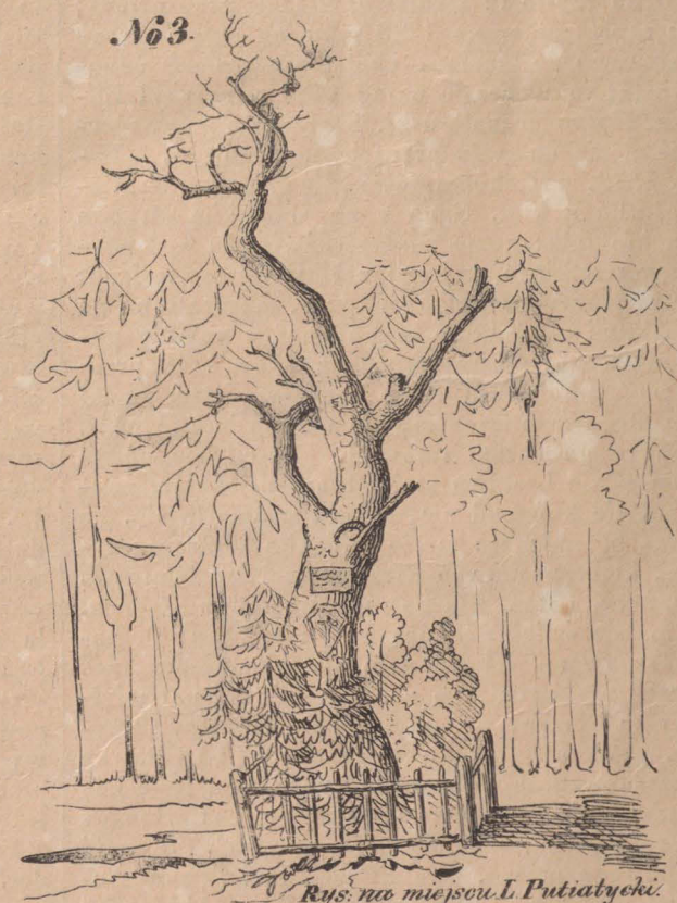
Rys. na miejscu I. Putiatycki.

No. 1. Zamek królewski w Niepołomicach był dawniej o 1 piętro wyższy, w czworokąt budowany, zupełnie podobny królewskiemu w Krakowie i tak filarami wewnątrz przyozdobiony; jest w nim sala duża w ten sposób sklepiona, że dwie osoby w przeciwległych kątach stojące, jeśli jedna z nich zupełnie pochiczu cokolwiek wyrzecz, druga przychyliwszy ucha do ściany, jak najdokładniej usłysz, co tamta wyrzecz. Od niepamiętnych czasów co rok na Śty Wojciech dwóch ludzi z pobliskiej wsi Mścienczyn są obowiązani cały ten zamek zamiatać, i ten zwyczaj do dziś trwa. Ma to z tąd pochodzić, że Śgo Wojciecha ta wieś nie dobrze przyjęła.