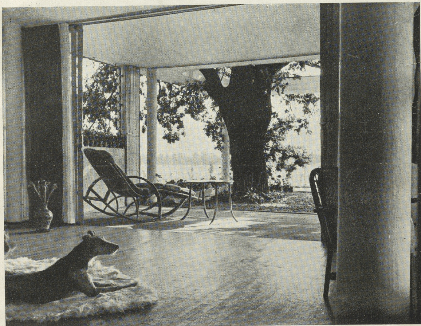
WIDOK Z POKOJU NA TARAS