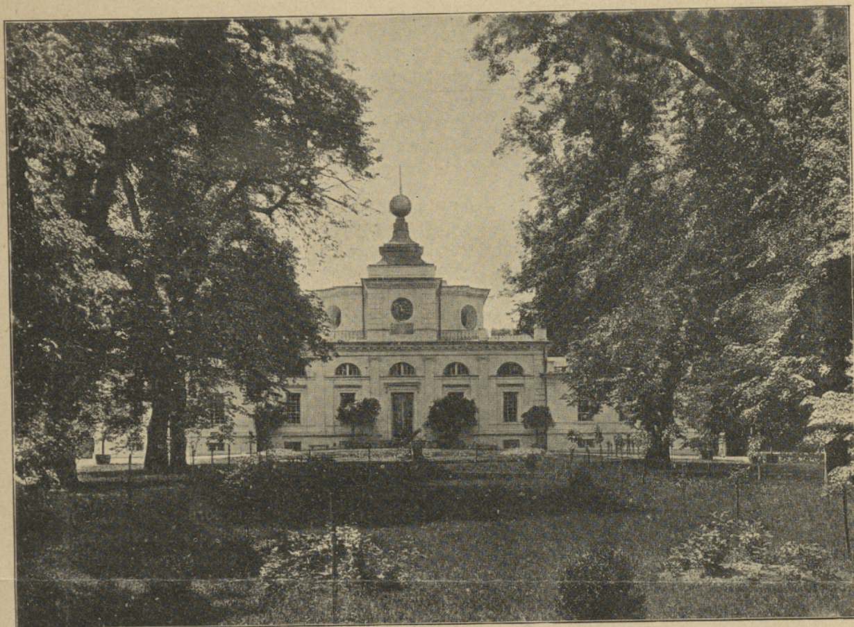
PALAC W JABŁONNIE, POW. WARSZAWSKI.