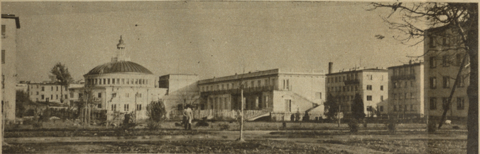
Kompleks teatru i Domu Kultury na Żoliborzu był pomyślany i zaprojektowany jako jedna całość. Stąd dla teatru, który miał być teatrem dla zespołu amatorskiego, a nie dla zespołu zawodowego, nie przewidywano koniecznego zaplecza. Po „separacji” nastąpiły przeróbki.

Bloki galeriowe były nowością w ówczesnym budownictwie warszawskim, a ich wzniesienie spotkało się z wieloma sprzeciwami. Profesor Brukalski zaprojektował domy galeriowe, opierając się na przekonaniu, że na pewno mieszkańiec bloku będzie wolał wchodzić do swego mieszkania z balkonu, z którego rozciąga się widok na zieleni osiedlowego dziedzińca, aniżeli z wąskiej, ze względów ekonomicznych, klatki schodowej. Budowa dalszych kolonii przynosiła coraz to nowe rozwiązania, idące dalej po linii niestwarzania zabudowy koszarowej. Nowe kolonie coraz lepiej rozwiązywały koncepcję rozmieszczenia bloków, jak na Żoliborz dużych, na terenie mocno zazielenionym. Realizacja kolonii siódmej przyniosła bloki półkoliste, stwarzające miłe wnętrza. Realizacja natomiast ostatniej kolonii, trzynastej, przyniosła budowę bloku typu hotelowca, dającego ciekawe rozwiązania ekonomiczne. Blok ten zawiera tanie, jednopokojowe lokale, z wnęką w przedpokoju na kuch-