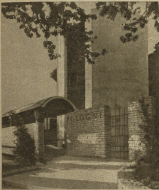
Pawilon polski na wystawie w Paryżu.