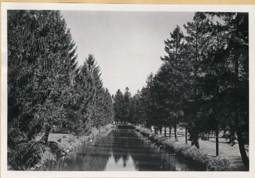
fol. J. Glinka 1933 v neg. PAN JS nr 26317