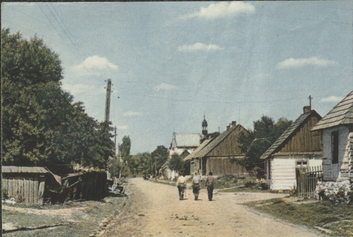
Nowa Słupia pamięta czasy Władysława Jagiełły