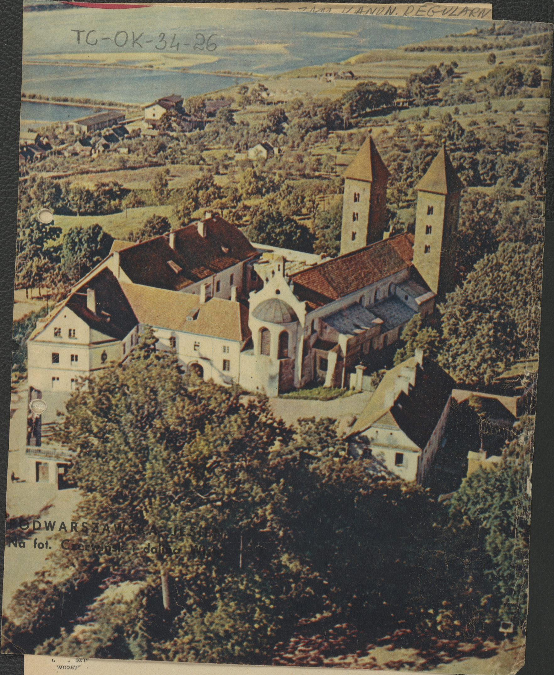
PODWARSZAWSKA, JESIEŃ Na fot. Czerwiński i dolina Wisły