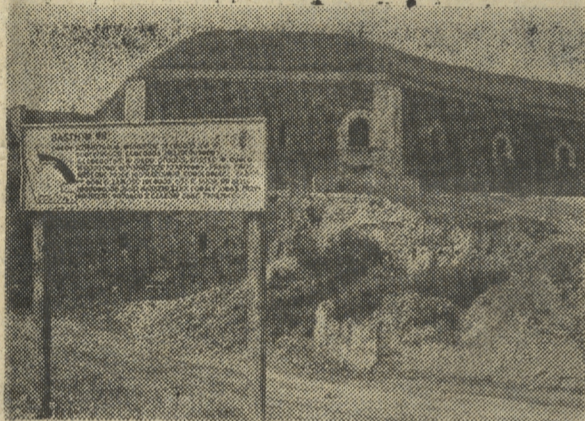
Bastion VII będzie gotów za rok. Tutaj widzimy jego fragment jeszcze przed rozpoczęciem rekonstrukcji.