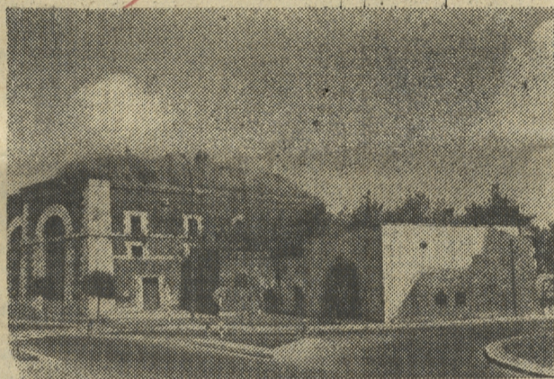
Tak obecnie wygląda Brama Lwowska Stara. Za nią widoczny fragment potężnego nadszańca flankującego północno-wschodnią kurtynę fortyfikacji z czasów Królestwa Polskiego.