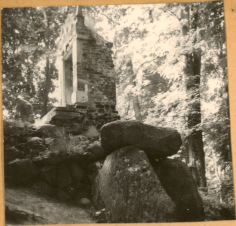
E Szelest 1981