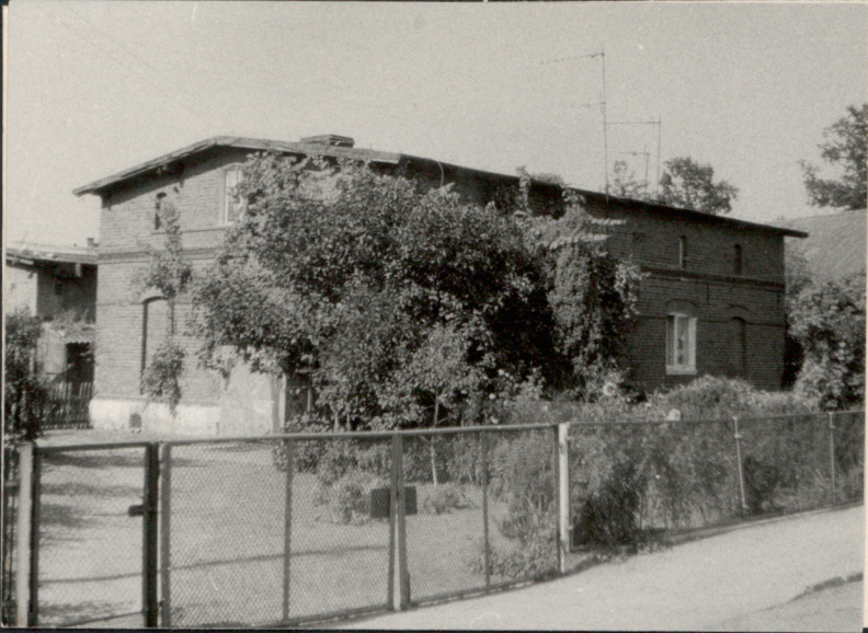
W. Kopyński gm